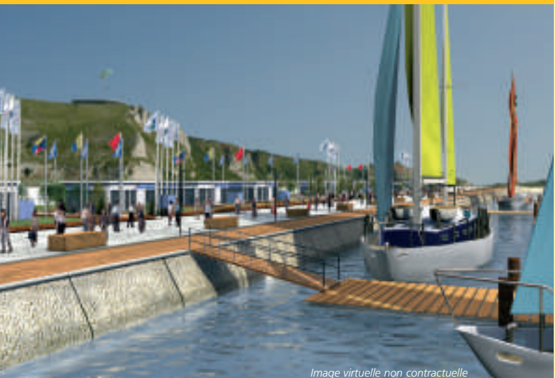
Image virtuelle non contractuelle