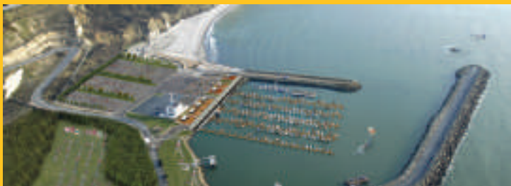
Projet de l'association SJBDD - image virtuelle non contractuelle

Afin de répondre à un véritable besoin avec des retombées économiques à long terme, un port de plaisance HQE ( Haute qualité environnementale ) de 500 anneaux serait le point de départ d'une réelle dynamique. Le département a recensé un besoin de 1 000 anneaux.